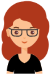
Mª Carmen Bello

FECYT carmen.bello@fecyt.es 91 425 09 09