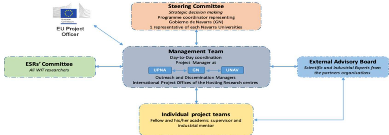
Figure 5. Management structure within the WIT Programme