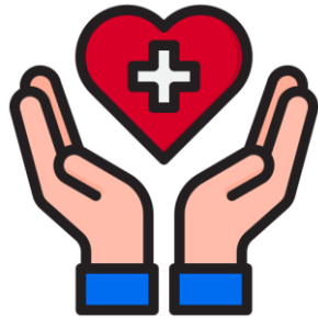
Salud y bienestar