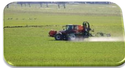
Agriculture & Forestry