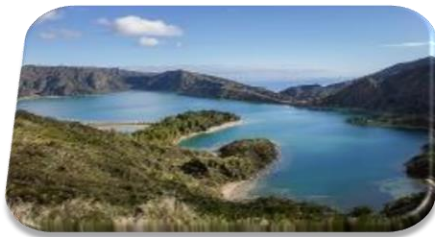
Biodiversity, Natural Capital