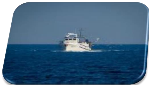
Seas, Oceans & Inland Waters